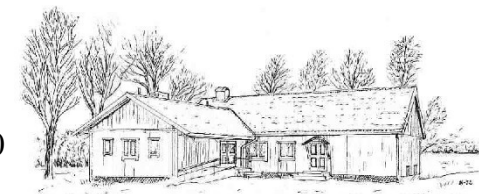
Bolmsö Bygdegård Sjöviken