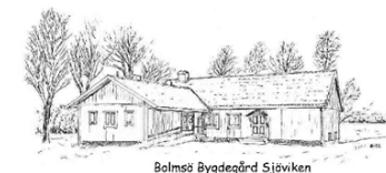
Bolmsö Bygdegård Sjöviken